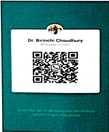
1. WhatsApp Group

অধ্যক্ষৰ সৈতে সংযোগ কৰিবলৈ QR Code দুটা স্কেন কৰক: